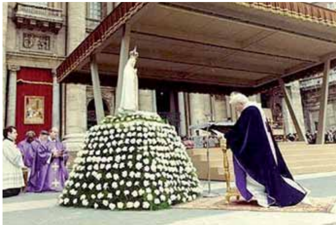
Consagración por Juan Pablo II el 24 de marzo de 1984

«De un modo especial te confiamos y consagramos aquellos hombres y aquellas naciones, que de esta entrega y de esta consagración tienen particular necesidad. Bajo Tu amparo nos acogemos, Santa Madre de Dios, No desprecies nuestras súplicas, que estamos en momentos de prueba.»