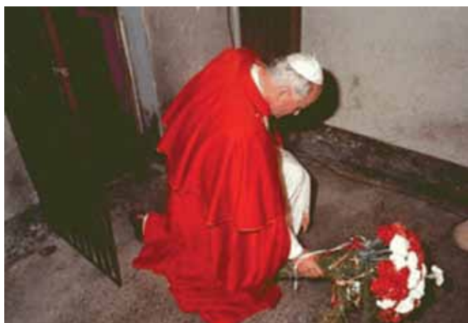
Juan Pablo II visitando la celda donde el P. kolbe murió

A finales de julio de 1941, un prisionero del bloque 14, el del padre Maximiliano, acaba de escaparse. El jefe del campo había advertido que, por cada fugitivo, se condenaría a morir de hambre y de sed a diez hombres. Uno de los desdichados (Franciszek Gajowniczek) designados para morir grita: «¡Qué será de mi mujer y de mis hijos! ¡Ya no los volveré a ver!». Entonces, en medio de sus atónitos camaradas, el padre Maximiliano se abre camino y sale de entre las filas: «Quisiera morir por uno de estos condenados», señalando al que acaba de lamentarse. ¿Quién eres tú, pregunta el jefe? «Un sacerdote católico», responde el padre, pues quiere entregar su vida como sacerdote católico. El oficial, estupefacto, guarda un momento de silencio y luego acepta aquella heroica proposición.