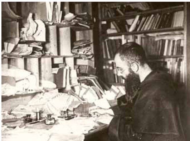
P. Kolbe trabajando en su oficina en Niepokalanow

Pero el santo llegará a experimentar que no puede hacerse el bien sin la cruz. En efecto, como lo recuerda Santa Teresa del Niño Jesús, «solamente el sufrimiento alumbró las almas». Hacia finales de 1919, es enviado a Zakopane, a un sanatorio donde falta ayuda religiosa. Aunque se halla enfermo, emprende un difícil apostolado entre sus compañeros, con la ayuda de medallas milagrosas. Consigue así ganarse los corazones uno a uno, y lo hace tan bien que es invitado a impartir conferencias. El apóstol de María sabía que pasaría, y muchos incrédulos se convierten.