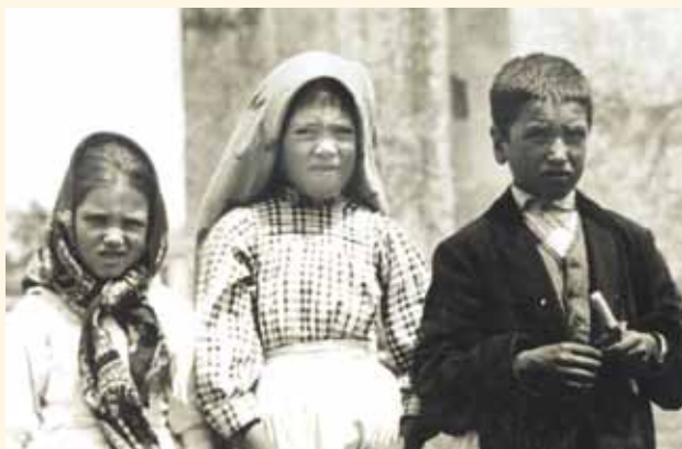
Foto de los tres videntes de Fátima tomada el 13 de julio de 1917, después de la visión del infierno

A menudo Jacinta se arrodillaba, con las manos juntas, para recitar la oración que Nuestra Señora les había enseñado: «Oh Jesús mío, perdona nuestros pecados, líbranos del fuego del infierno, lleva al Cielo a todas las almas, especialmente a las más necesitadas de tu misericordia». Ella permanecía largos momentos en oración, invitando a los otros dos videntes a hacer lo mismo: ¿Francisco, Lucía, rezan conmigo? ¡Debemos orar mucho para evitar que las almas vayan al infierno! Otras veces Jacinta le preguntó a Lucía: ¿Por qué la Santísima Virgen no permite que los pecadores vean el infierno? Si lo vieran, ya no pecarían, para no caer ahí. Debes decirle a esta Nuestra Señora que muestre el infierno a todas estas personas (presentes en el momento de la aparición), verás cómo se convertirán.