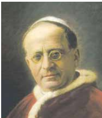
Papa Pio XI

“Hay ciertas categorías de bienes por los que podemos sostener y con razón que deben ser reservados a la colectividad, cuando confieren tal poder económico que no puede, sin peligro para el bien común, dejarse al cuidado de individuos privados.” (Papa Pío XI, encíclica Quadragesimo Anno )