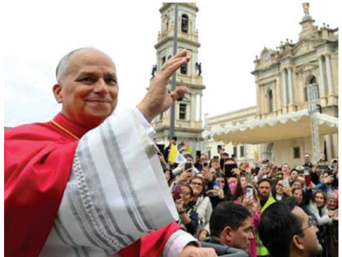
León XIV frente al Santuario de Nuestra Señora del Rosario de Pompeya

María se convierte así en Madre de la misericordia. Discípula de la Palabra e instrumento de su encarnación, se revela verdaderamente como la «llena de gracia». ¡Todo en ella es gracia! Al ofrecer al Verbo su propia carne, ella se convierte también, como enseña el Concilio Vaticano II siguiendo a san Agustín, en «madre de los miembros (de Cristo) ... porque coo-