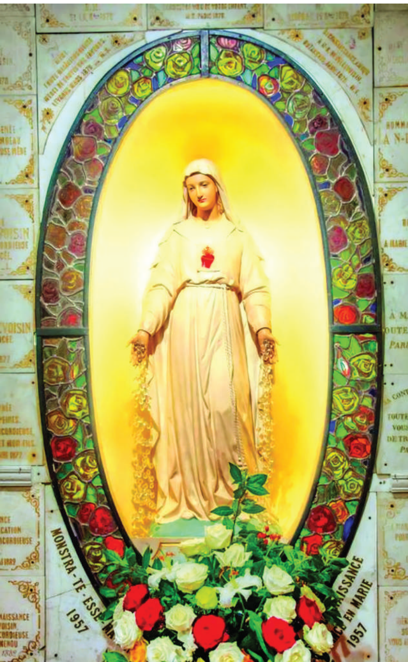
Nuestra Señora de la Misericordia de Pellevoisin