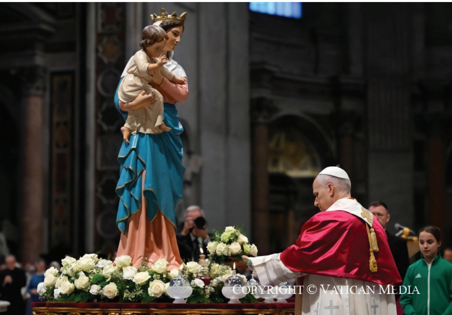
León XIV deposita flores ante la estatua de Ntra. Sra. de la Paz durante la vigilia de oración del 11 de abril.

posibilidades humanas se unen en la oración a las infinitas posibilidades de Dios. De este modo, pensamientos, palabras y obras rompen la cadena demoníaca del mal y se ponen al servicio del Reino de Dios; un Reino en el que no hay espada, ni drones, ni venganza, ni banalización del mal, ni lucro injusto, sino sólo dignidad, comprensión y perdón. Tenemos en esto una barrera contra ese delirio de omnipotencia que se vuelve cada vez más impredecible y agresivo a nuestro alrededor.