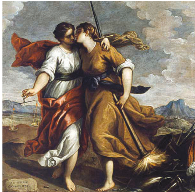
«Justice et Paix s'embrassent», peinture à l'huile de Jacopo Palma le Jeune (1544-1628), Galerie et Musée Estense de Modène, en Italie