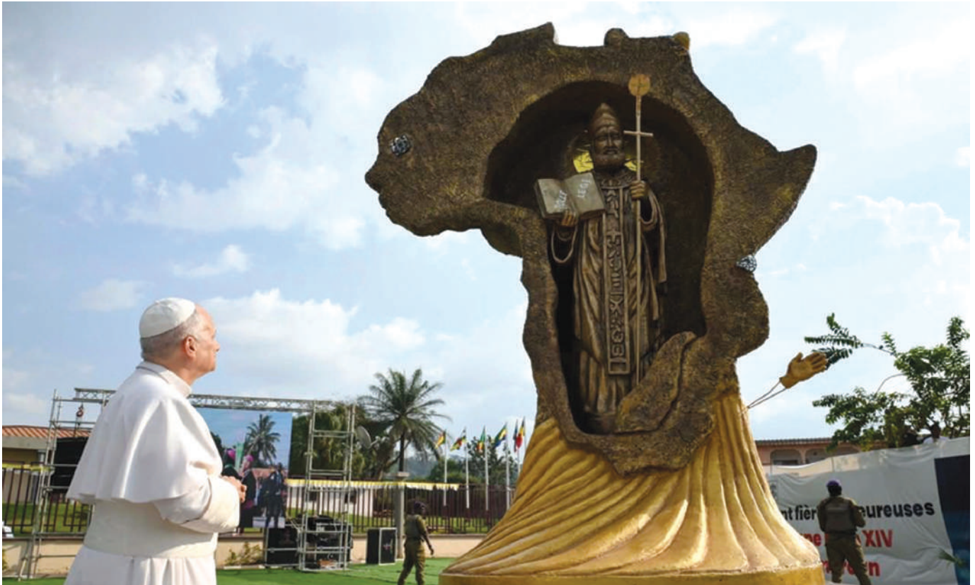
El Papa León XIV frente al monumento dedicado a san Agustín, inaugurado con motivo de su visita e instalado frente a la Universidad Católica de África Central en Yaundé, de la cual san Agustín es el santo patrono.

aquí la razón de ser de su Universidad, fundada hace treinta y cinco años para formar pastores de almas y laicos comprometidos con la sociedad: estos son los testigos de sabiduría y equidad que el continente africano necesita. (...)