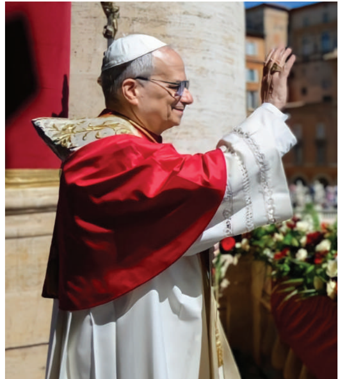
Leon XIV bendice a la multitud el Domingo de Pascua

rra y la rechaza diciendo: «Por más que multipliquen las plegarias, yo no escucho: ¡las manos de ustedes están llenas de sangre!» (Is 1,15)... Cristo, Rey de la paz, vuelve a clamar desde la cruz: ¡Dios es amor! ¡Tengan compasión! ¡Depongan las armas, recuerden que son hermanos!»