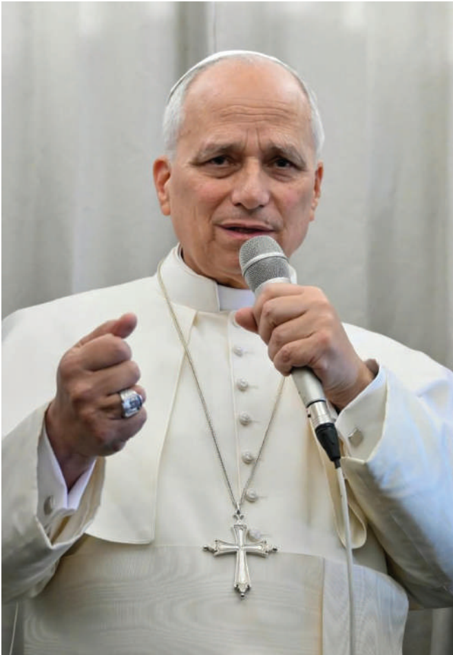
León XIV responde a los periodistas a bordo del avión papal